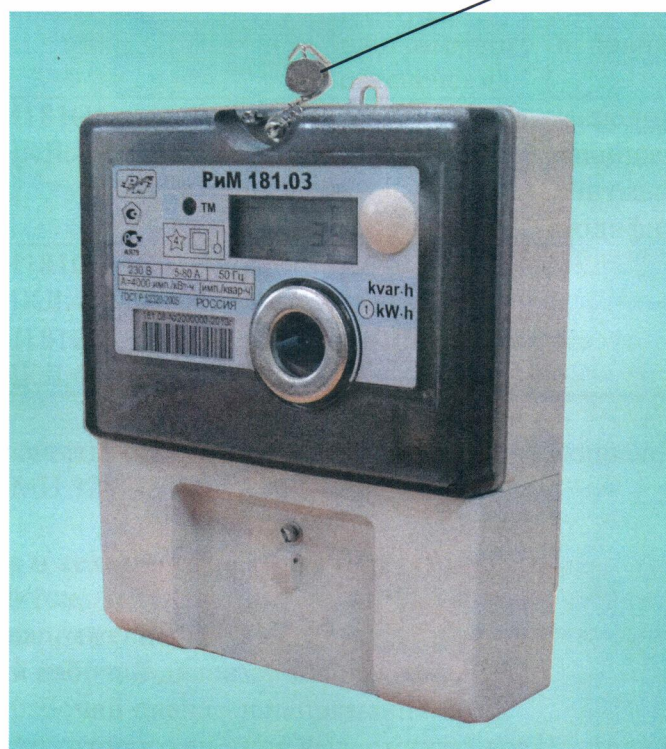
Рисунок 2 - Фотография общего вида и место установки пломбы поверителя счетчиков РиМ 181.03 производства ООО «РИМ-РУС»